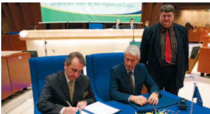
Jaume Bartomeu, Jefe de Gobierno de Andorra, firma en nombre del Principado la Carta Europea de Autonomía Local.

En el marco de esta última Sesión Plenaria –la 19ª– también se abordaron otras cuestiones de interés desde las Comisiones de trabajo; así, en la Comisión de Desarrollo Sostenible se presentaron tres informes para el debate, relativos a la sostenibilidad en