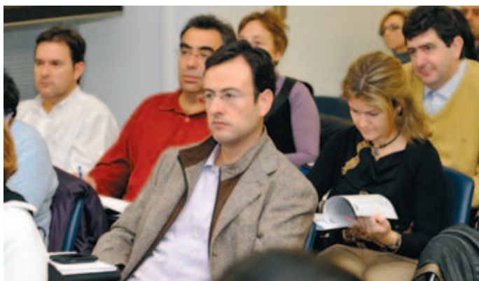
La FEMP tiene una participación activa en foros sobre políticas activas de empleo.

La FEMP ha remitido este acuerdo al Ministerio de Asuntos Exteriores y de Cooperación y a la Embajada de Marruecos en España.