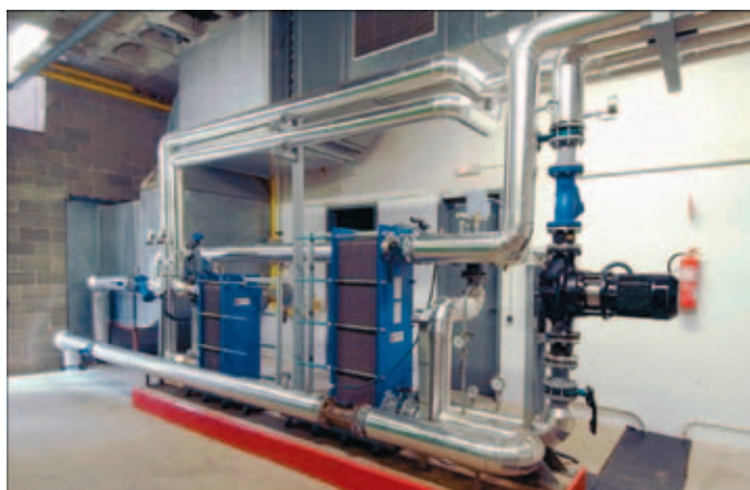
El "Tubo Verde" de Mataró da servicio a instalaciones y edificios municipales.

El proyecto "Núcleo Energético" aplica prácticas de ahorro y uso eficiente de la energía en los ámbitos social, institucional y económico de los municipios pontevedreses de Barro, Poio, Ponte Caldelas y Vilaboa. La iniciativa comenzó en 2007 y comprende la construcción de infraestructuras de energía solar y fotovoltaica, así como auditorías energéticas en todas las Casas Consistoriales, instalaciones deportivas y de alumbrado público.