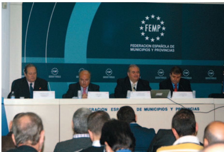
Público y mesa del IV Encuentro.

El pasado 25 de noviembre, organizado por la FEMP y Aon, se celebró en la sede de la Federación el 5º Encuentro de Administración Local y Gestores de Riesgos, en el cual prestigiosos juristas y representantes del sector asegurador trataron diversos aspectos de la responsabilidad en la que incurren las Corporaciones Locales, así como sus autoridades y empleados.