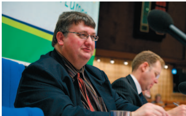
Keith Whitmore, nuevo Presidente del CPLRE.

El Congreso de Poderes Locales y Regionales de Europa, órgano consultivo vinculado al Consejo de Europa, cuya principal misión es garantizar la democracia local y regional en el continente, ha redefinido sus prioridades y modificado su estructura y procedimientos de trabajo con el fin de ganar presencia, y resultar más útil y tangible para los ciudadanos. Esta reorientación del CPLRE ha sido propuesta y aprobada en el marco de su última Sesión Plenaria, en la que, además, se ha elegido a los nuevos Presidentes para el Consejo y sus Cámaras Local y Regional, así como a los miembros del Buró.