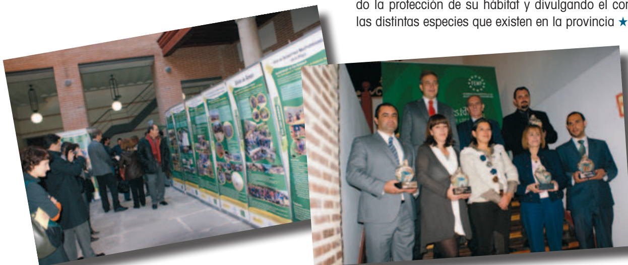
Exposición de los proyectos de voluntarios en el patio de la FEMP y foto de los galardonados

La Diputación de Palencia presentó la iniciativa de un grupo de aficionados a la micología, denominada "Asociación de Guías Micológicas corro de brujas", en la que tienen cabida personas muy diversas, como agricultores, amas de casa, estudiantes o empresarios. En las 52 salidas que realizan al año impulsan la defensa y conservación de los recursos micológicos, promoviendo la protección de su hábitat y divulgando el conocimiento de las distintas especies que existen en la provincia ★