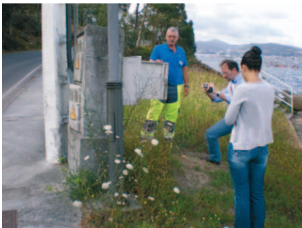
Los municipios de Barro, Poio, Ponte Caldelas y Vilaboa, realizaron auditorías energéticas -en la imagen-.