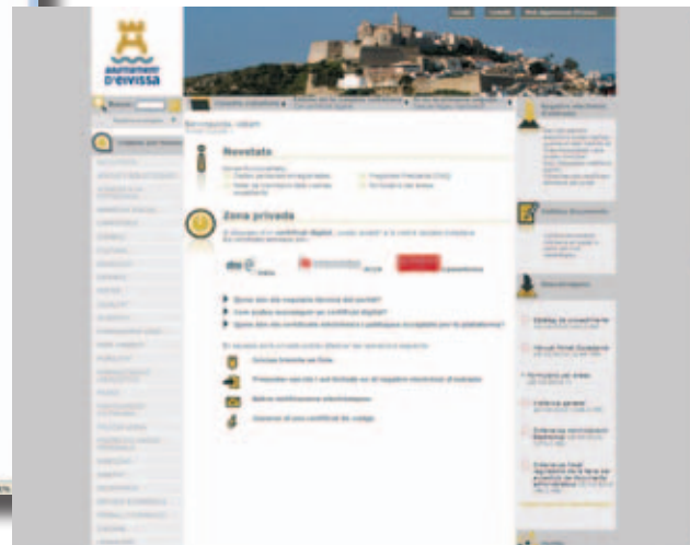
Webs de las experiencias de Eivissa y Lleida, presentadas en la Jornadas.

cada ciudadano disponible en las diferentes bases de datos del Ayuntamiento –el padrón, por ejemplo-, el estado de tramitación de los expedientes iniciados por vía electrónica por el ciudadano y un acceso directo tanto a los documentos electrónicos presentados por él como a los remitidos por el Ayuntamiento.