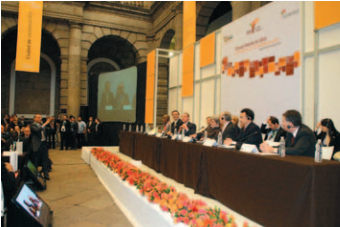
Reunión de trabajo durante la Cumbre.