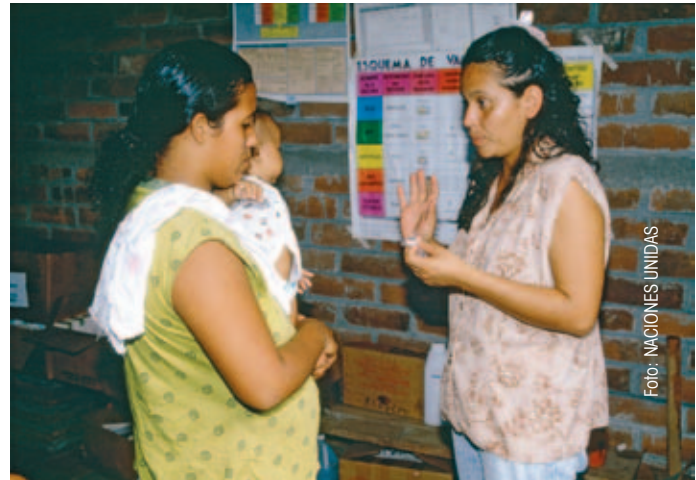
Los programas de salud fueron uno de los sectores que recibieron más financiación.

la aportación a educación para el desarrollo y sensibilización social supuso 11,37 millones (un 7,73%). Al comparar estas cifras con las de años anteriores hay que destacar el incremento experimentado por Educación para el desarrollo y sensibilización social, que por primera vez en el período estudiado (entre 2005 y 2009) supera el 10%, una tendencia que venía apuntando desde 2005. Sin embargo, los Fondos destinados a Acción Humanitaria apenas superan el 5%, bajando así más de tres puntos en relación con 2008, lo que muestra que, en ausencia de graves emergencias humanitarias, la mayor parte de la ayuda se destina a cooperación.