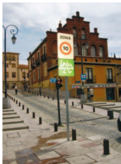
Zonas peatonales en el caso histórico de León.

Los Ayuntamientos pontevedreses de Barro, Poio, Ponte Caldelas y Vilaboa, agrupados en una asociación comarcal, y los de León, Pamplona y Mataró (Barcelona), han obtenido el máximo galardón por su buen hacer en el empeño de combatir el cambio climático en la tercera edición del Premio a las Buenas Prácticas que otorga la FEMP, a través de la Red Española de Ciudades por el Clima.