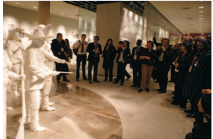
Visita al Centro histórico de Ciudad de México.

precisa de un sistema de transporte público integrado, accesible y bien comunicado con todos los puntos clave dentro de la ciudad y región, según señala el manifiesto; asimismo propone una ciudad apta para el empleo, que oriente su desarrollo económico hacia las necesidades y tecnologías del futuro, con un clima de empresa que la haga óptima para hacer negocios que ofrezcan empleos dignos. En esta propuesta se destaca la importancia de que la ciudad forme parte de una red de ciudades que favorezca los polos de actividad e investigación, una red integrada en una estrategia más amplia.