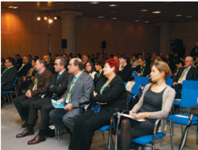
Participantes en el debate sobre ciudad y sostenibilidad.