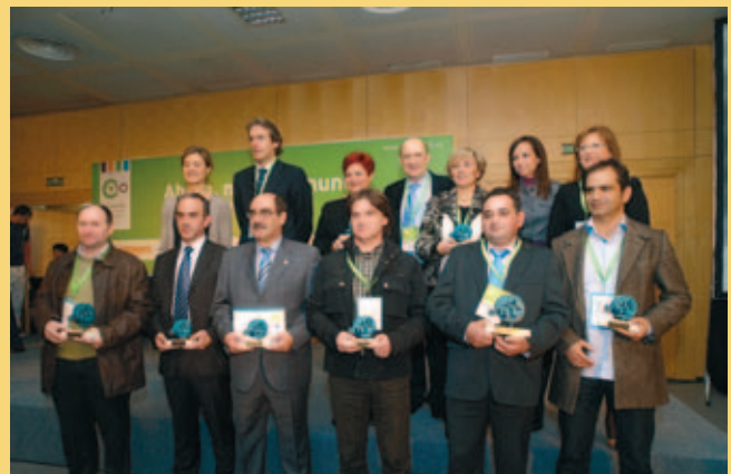
Representantes de los municipios premiados posan tras el acto de entrega.

En el caso de Tineo, se trata de un proyecto de recuperación de una Laguna, denominada de El Arenero, un espacio lacustre de aproximadamente una hectárea de superficie que en los años setenta se usaba como cantera de arena. En 2003 el Ayuntamiento de Tineo y el Gobierno Regional comenzaron los trabajos de recuperación con el objetivo de crear un coto de pesca intensivo para uso público. El Consistorio firmó un convenio con la Asociación de Pescadores del lugar, que se encarga de la gestión del paraje desde su inauguración en 2006. La iniciativa es innovadora porque es el único ejemplo en el Principado de Asturias en el que una entidad local y una ONL aúnan sus esfuerzos para gestionar un espacio de pesca recreativa. Unas 15.000 personas visitan al año este centro de pesca, con una media de 6.000 permisos por temporada. La gestión económica es autosuficiente y permite la creación de dos puestos de trabajo a jornada completa.