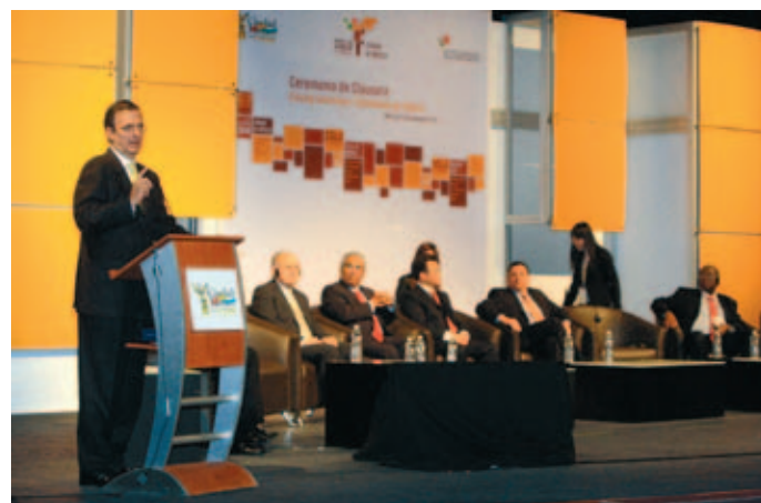
Los nuevos cargos de CGLU escuchan la intervención del Alcalde de Ciudad de Méjico, Marcelo Ebrard.