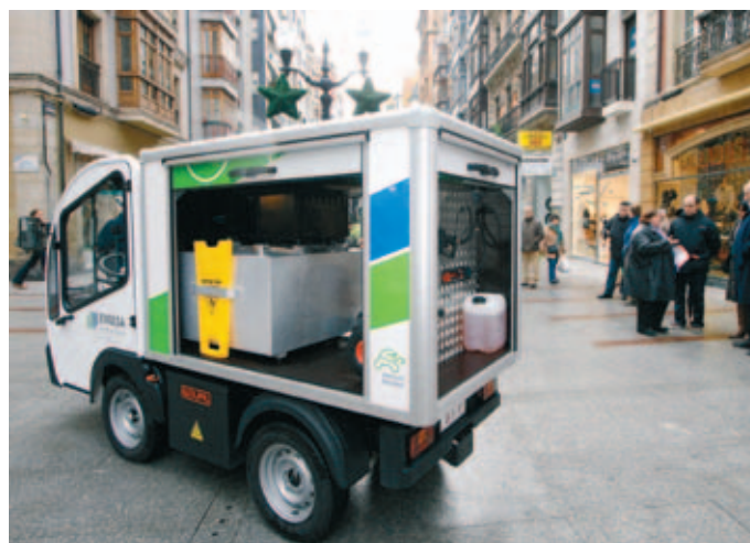
Uno de los 10 vehículos nuevos eléctricos de la flota municipal de limpieza de Gijón.

Los ejes principales de la tarea que pretenden desarrollar comprenden aspectos medioambientales, fiscales y administrativos, de circulación y desarrollo de infraestructuras urbanas, de requisitos para nuevas edificaciones, de servicios públicos y de comunicación y formación.