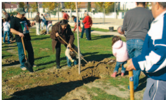
La Federación ha hecho un llamamiento a los Ayuntamientos con motivo del Día y del Año Internacional del Voluntariado

La Comisión Ejecutiva de esta Federación reitera, de esta forma, la llamada realizada el pasado año y recuerda que la lucha contra la pobreza y la desigualdad en el mundo sigue siendo uno de los retos a los que se enfrenta nuestra sociedad. Acabar con esas lacras "no sólo es un compromiso ético, sino una de las condiciones básicas para lograr un mundo más justo" –señala– y tampoco es el momento de retroceder, sino de acelerar los avances hacia el logro de los Objetivos del Milenio.