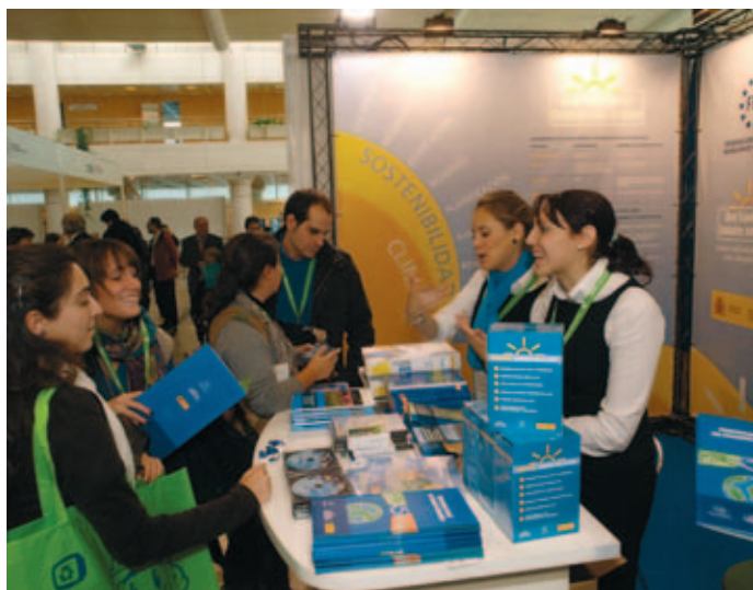
Stand de la FEMP en CONAMA.

En concreto, se refirió a las políticas locales en materia de movilidad urbana, incorporando la variable de la sostenibilidad, de apuesta por las energías renovables o de ahorro y eficiencia energética. También destacó el trabajo de optimización del uso de los recursos hídricos y del desarrollo de sistemas sostenibles de gestión de residuos que permitan reducir al mínimo posible la generación de emisiones de gases de efecto invernadero en nuestros municipios.