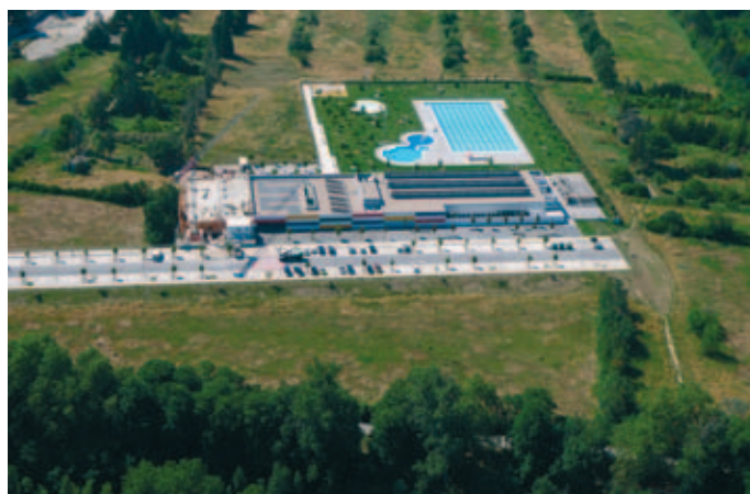
Ciudad Deportiva San Jorge, en Pamplona, "edificio cero" en emisiones.

Uno de los ejemplos emblemáticos de esta política es la Ciudad Deportiva de San Jorge. Un complejo deportivo municipal en el que todas las medidas impuestas bajo los criterios del ECODISEÑO confluyeron en un gran Proyecto desde el punto de vista energético y sostenible, alcanzándose la caracterización de edificio con "Cero Emisiones" en instalaciones térmicas ★