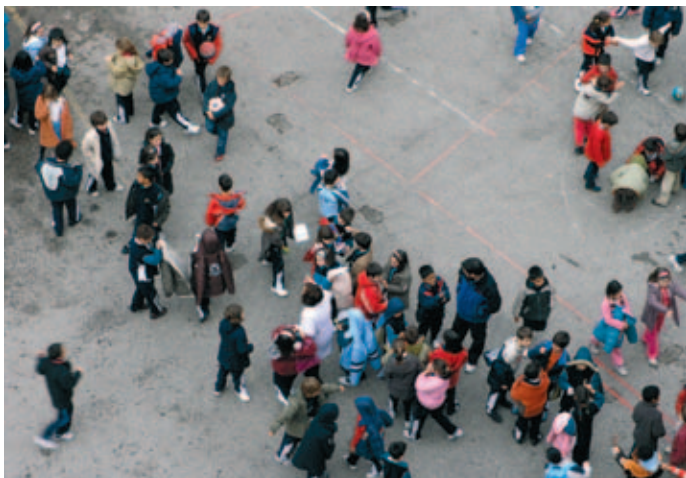
Los Gobiernos Locales reivindican su protagonismo en la evaluación de las necesidades de la ciudad en materia educativa.

oferta del municipio, como por ejemplo, las escuelas infantiles, casas de niños, compensación educativa, educación de adultos o actividades extraescolares, entre otros.