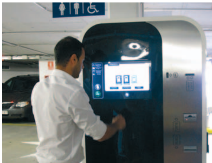
Algunos municipios ya cuentan con puestos de carga para los coches eléctricos, como el caso de Vigo.

En concreto, está prevista la difusión de la Guía elaborada por este organismo en los municipios de más de 50.000 habitantes, una tarea que será llevada a cabo por la FEMP. Al mismo tiempo, esta Federación se encargará de identificar buenas prácticas en movilidad sostenible, relacionadas con el vehículo eléctrico, y de estar presente en la selección de aquellas que se distingan por su buen hacer con el Sello de Ciudades con Movilidad Eléctrica.