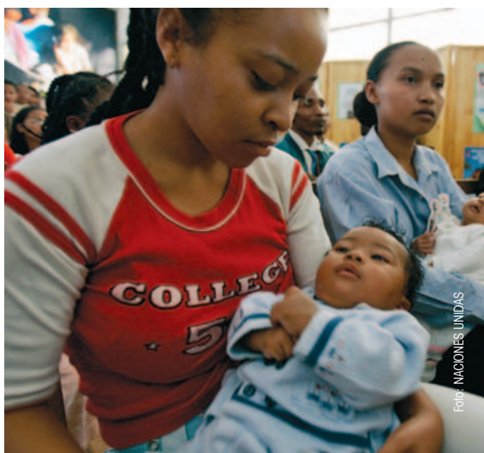
El capítulo de salud reproductiva supuso casi el 3% de la AOD local.

El resultado de este análisis se concreta en afirmaciones como que América Latina continúa siendo el destino prioritario de los Fondos, al recibir un 64,77%; África Subsahariana se consolida como el segundo destino de la AOD local (17,75%); el área del Mediterráneo, con el 12,7%, se mantiene como destino preferente de la ayuda; las cifras globales de Asia-Pacífico también se mantienen (3,84%) en función de la ayuda destinada a la India (2,52%). Europa permanece como destino escasamente significativo, con un 0,47% ★