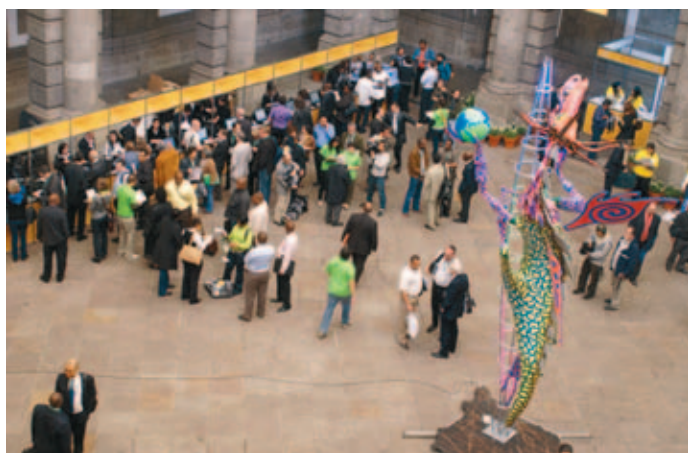
Zona de acreditaciones.

Una ciudad en la que las personas puedan circular libremente – una ciudad móvil- y de manera eficiente en sus desplazamientos,